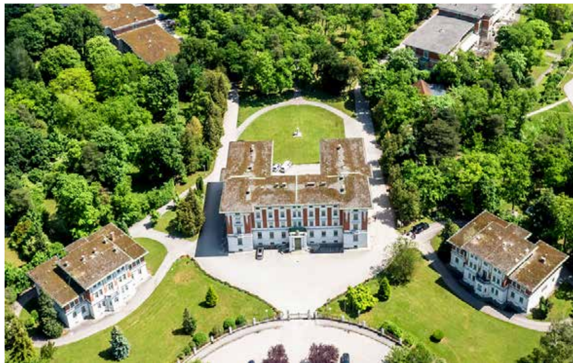
Landes- klinikum Mauer