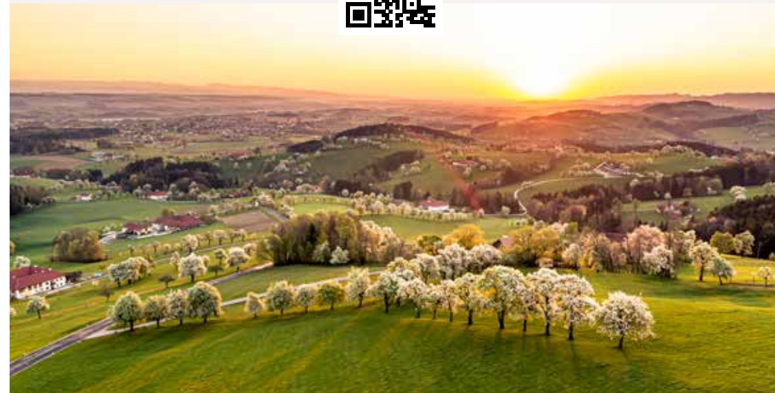
Blick in das Mostviertel / Baumbblüte