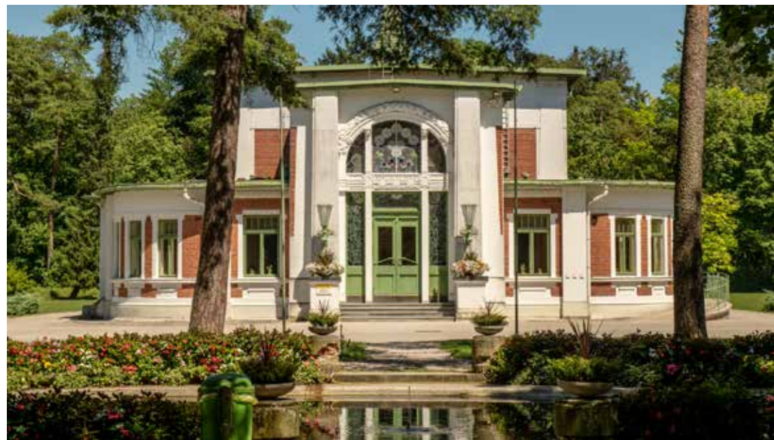
Landes- klinikum Mauer

Die Ausstellung im Direktionsgebäu- de wird sich mit unterschiedlichen Aspekten von geistiger Gesundheit und Krankheit sowie den gesell- schaftlichen Umgang mit psychischen Erkrankungen auseinandersetzen. Die Inhalte der Ausstellung werden dabei in Abschnitte gegliedert und deren Themen reichen dabei von der Suche nach dem Sitz im Körper, der unterschiedlichen Wahrnehmung von Krankheit und Gesundheit über die Errichtung der Heil- und Pflege- anstalten sowie der Veränderung der Behandlung von psychischen Erkran- kungen bis hin zur Antipsychiatrie- bewegung und den gegenwärtigen Anliegen der psychischen Gesun- dheit und Erkrankung.